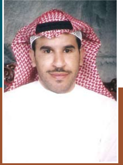
الشاعر قيس المهنا