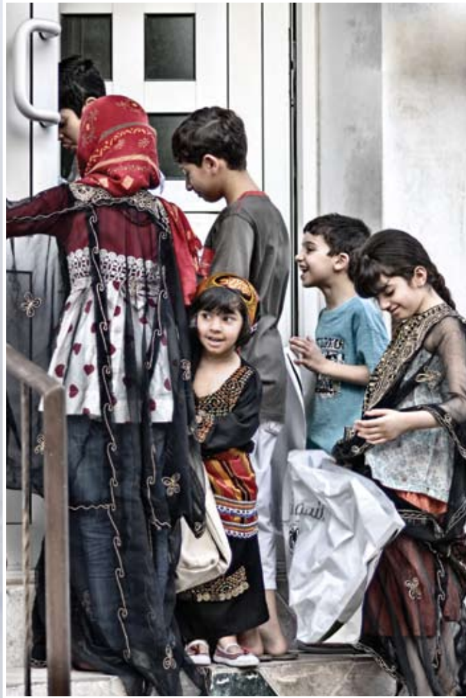
بعدسة المصور نايف الضامن باستخدام عدسة 85mm

تعمل عدسات الزوم بفعالية لتغطي الابعاد البؤرية التي صنعت من اجلها ولكن جميعها يظهر تشوها في الابعاد خصوصا عند الاطراف وبالطبع فانه من المستحيل ان يتم تصميم عدسة زوم لا تصنع تشوها في الابعاد لان ذلك سيجعل سعرها خياليا. العدسات الاساسية- من جهة اخرى- قد صممت لتعمل على بعد بؤري واحد وتم الاخذ بالحسبان التخلص تماما من أي تشوه قد يحدث للابعاد.