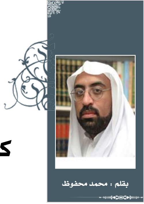
بقلم : محمد محفوظ