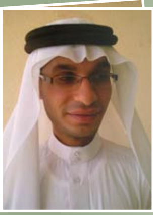
بقلم : حسن الخاطر