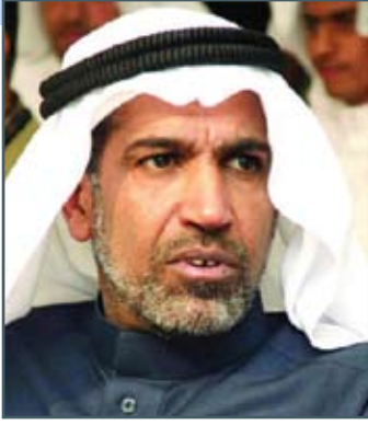
د. توفيق السيف