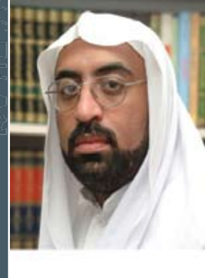
بقلم : محمد محفوظ