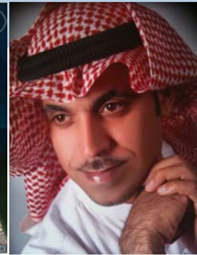
إعداد / مؤيد قريش