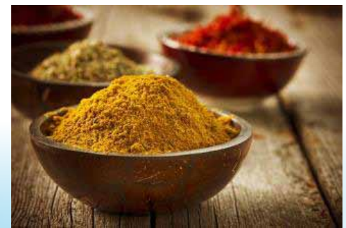
مواد غذائية وبهارات