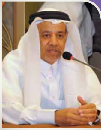
رئيس التحرير فؤاد نصرالله