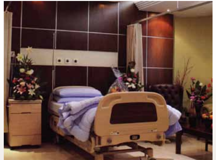
إحدى الغرف بأحد الأجنحة الفندقية الطبية

- أجد أن القطاع الصحي من أهم القطاعات ذات القابلية لمزيد من النمو والتوسع، والسبب في ذلك هو الزيادة المستمرة في الطلب على الخدمات الصحية، والناجمة بدورها عن النمو في عدد السكان الذي يزيد بمعدل مليون ونصف المليون في السنة، ففي العام ٢٠٣٠ سوف يصل عدد سكان المملكة حوالي ٥٠ مليون نسمة، فضلاً عن الزيادة المضطردة في أعداد العمالة الوافدة، والتوسع الدائم في النشاط الصناعي، كل هذا يجعل من المستشفيات والمراكز الصحية من النجح المشاريع الاستثمارية التي تحظى بتشجيع ودعم مباشر من قبل الحكومة، التي كما سبق القول لم تضع أي عائق أمام انطلاق أي مشروع صحي، ولا تضع أي عراقيل أمام استقدام العمالة في القطاع الصحي.. وسوف يتعزز دور القطاع الصحي الأهلي بدخول التأمين الإلزامي على المواطنين عام ٢٠١٥ حيز التنفيذ حيث سوف نشهد طفرة أخرى في النشاط عندما يتحول جميع المرضى من القطاع الحكومي إلى القطاع الخاص، وهذه الطفرة لن تكون في معزل عن النمو في القطاع الصحي الحكومي الذي سوف يشهد هو الآخر نمواً كبيراً بسبب المشروعات التي سوف تدخل الخدمة في نطاق السنوات القليلة القادمة، ولكنها بصورة مختلفة أيضاً، فالحكومة التي تنفق ٣ مليارات ريال سنوياً على العلاج في