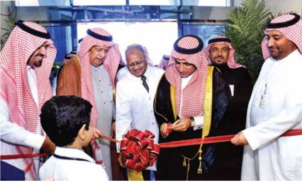
سعادة الرئيس التنفيذي للهيئة الملكية بالجبيل يقص شريط الافتتاح والى جواره رئيس مجلس إدارة مجموعة مستشفيات المانع والمدير الطبي