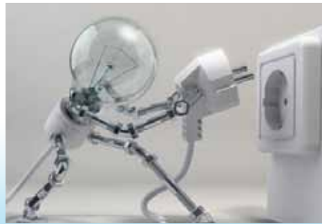
خدمات صناعية وكهربائية