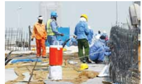
خدمات تشغيل زائد عمالة