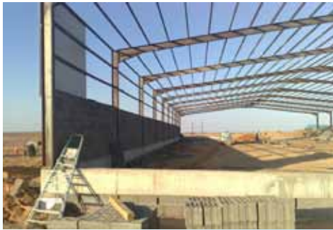
هناجر ومباني حديدية