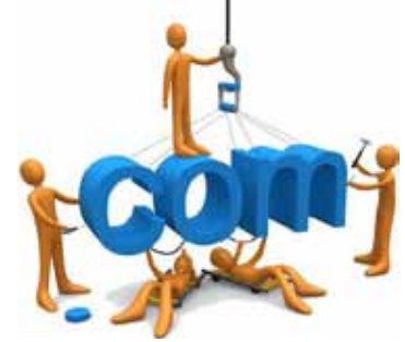
تصميم مواقع انترنت